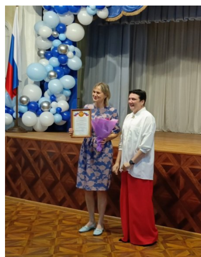
Награждение руководителей ОУ Грамотами Калининской районной организации Профсоюза образования