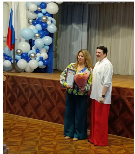
Награждение председателей ППО Грамотами Калининской районной организации Профсоюза образования

26 августа 2025 года состоялась пленарная часть Августовской конференции на единой общегородской площадке МАОУ «МЛ №148 г. Челябинска».