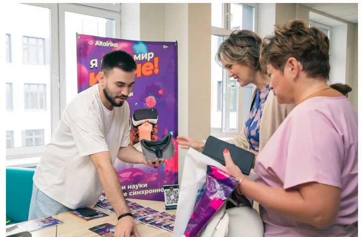
В фойе многопрофильного лицея №148 перед началом конференции