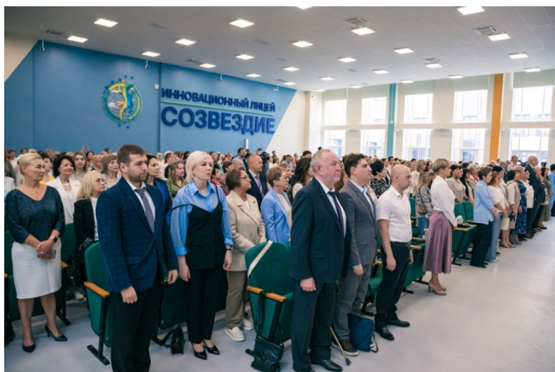
Звучит гимн Российской Федерации

За значимый вклад в развитие Российской школы и формирование будущего страны Почётное звание «Почётный работник сферы образования Российской Федерации» получили 3 заведующих детских садов. Почетными Грамотами Министерства просвещения Российской Федерации за высокие педагогические достижения были отмечены представители системы образования.