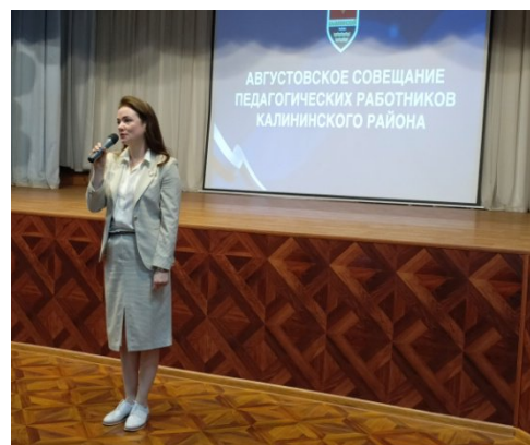
Приветственное слово Лось И.Н.

На районной Августовской конференции работников образования с докладами выступили: