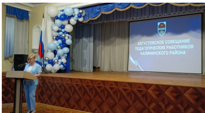
Выступление Поповой О.А.