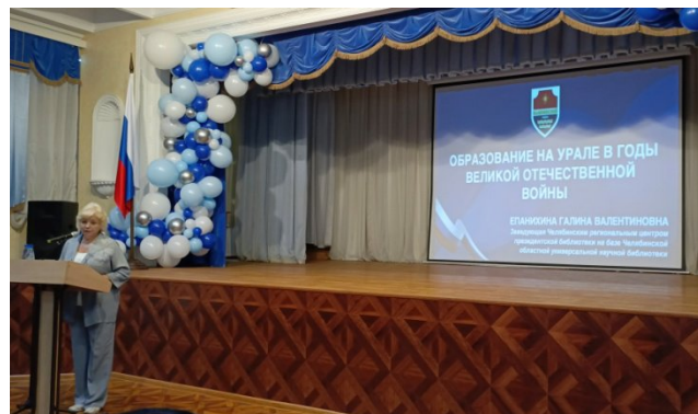
Выступление Епанихиной Г.В.